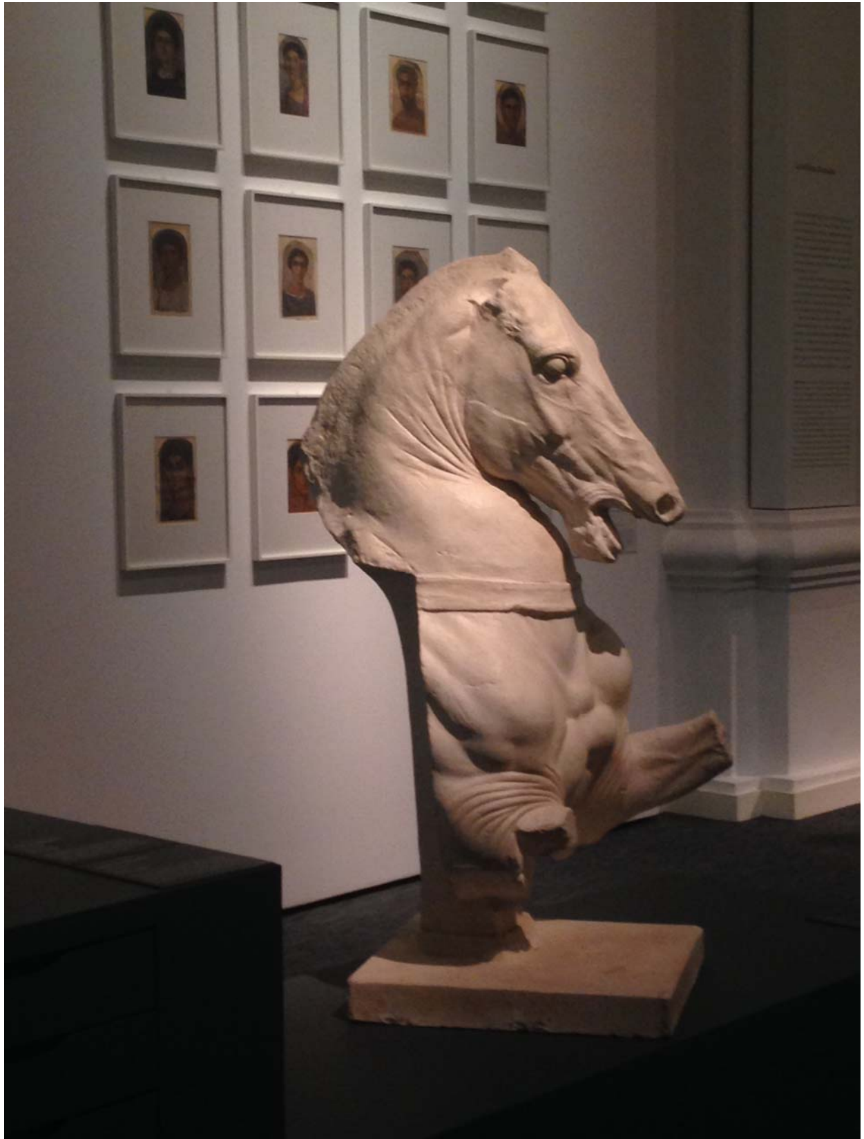
Copia de cabeza de caballo del friso del Partenón de Atenas. Original en el British Museum