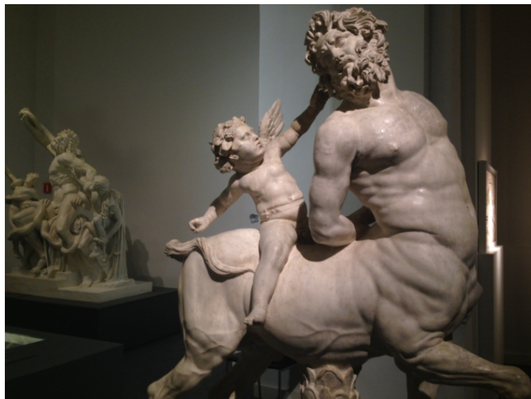
En la escultura se puede ver a Heros intentando dominar al centauro.

Su nombre puede proceder del griego: kentein “pinchar” o “punzar”, raíz de la que procede la propia palabra “centro” y en cuanto a la segunda parte de la palabra no se admite que proceda de tauros, latín: taurus “toro”. Se dice que procede del antiguo indio con el significado de “caballo”